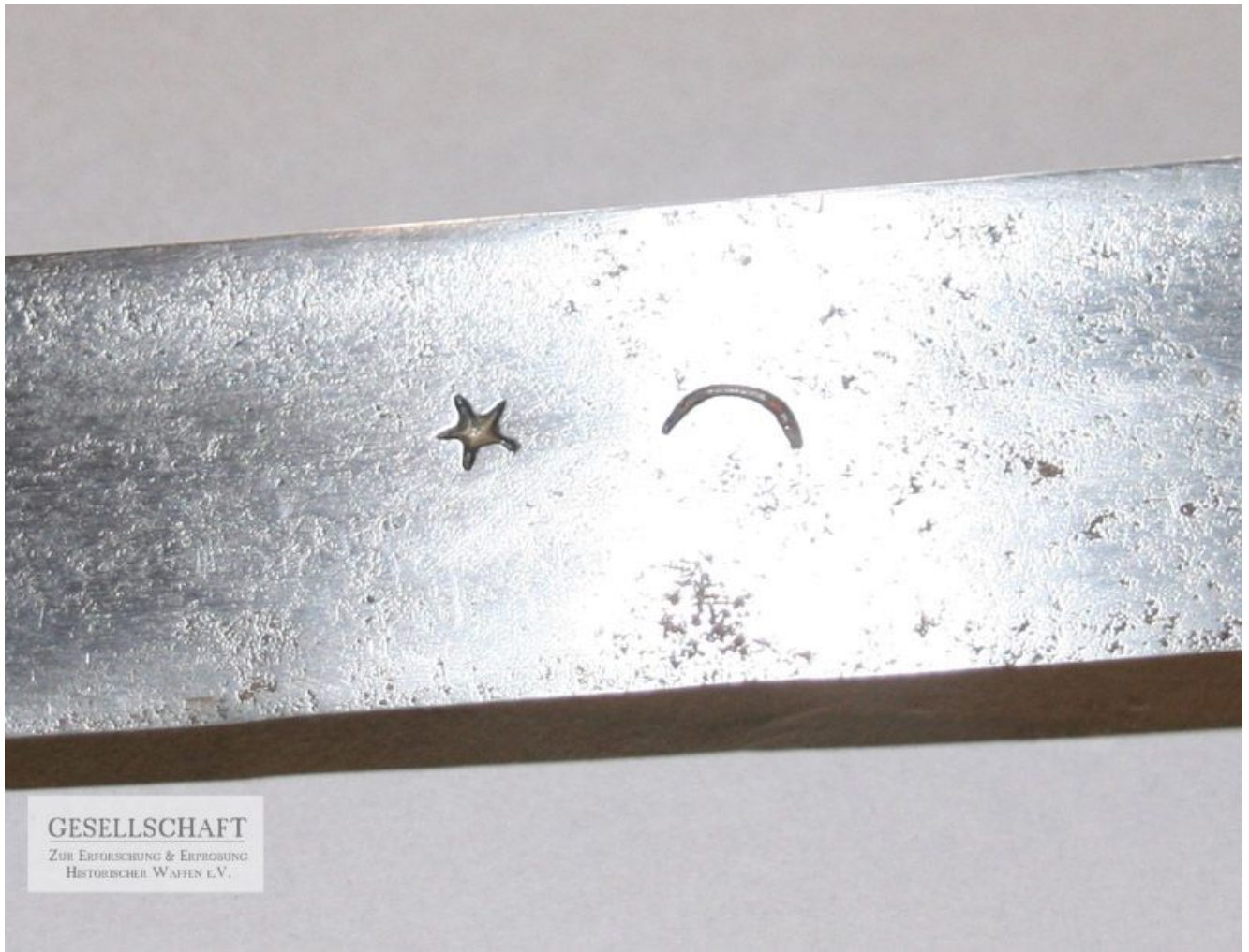
Detail: Schmiedemarken (Johannes Schmitzer)