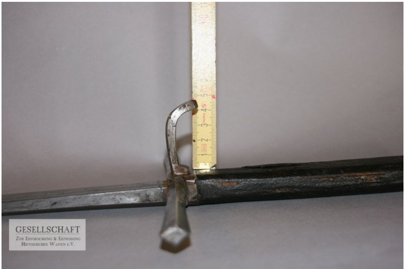
Detail: Rüstnagel in der Seitenansicht (Johannes Schmitzer)