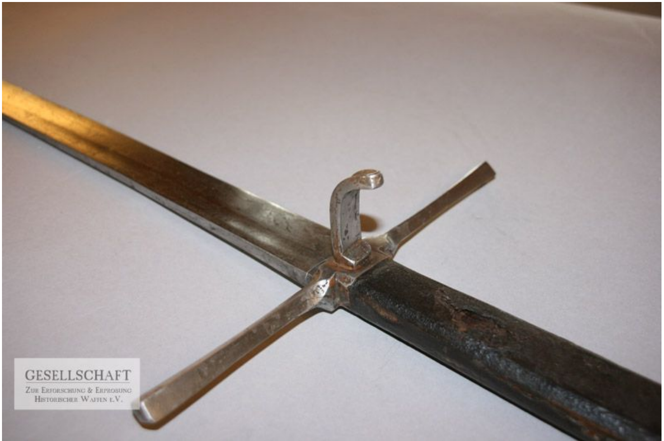
Detail: Kreuz und Rüstkopf Terzseite (Johannes Schmitzer)