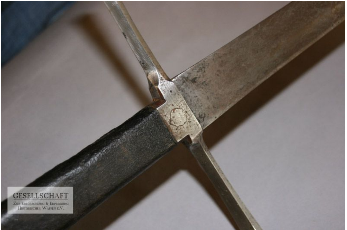
Detail: Rüstnagel Quartseite (Johannes Schmnitzer)