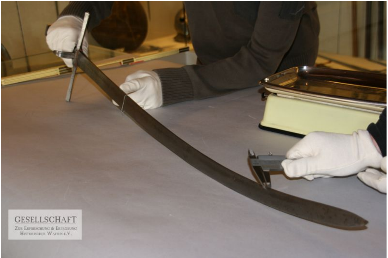
Langes Messer - Gesamtansicht (Johannes Schmitzer)